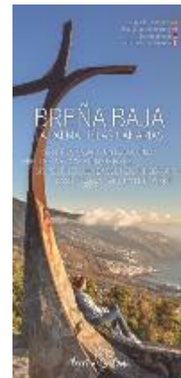
Mapa Villa de Breña Baja