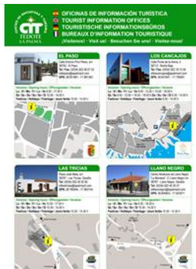
Guía Oficinas de Información Turística