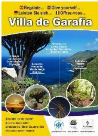
Volandera Villa de Garafía