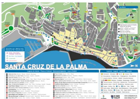
Callejero Santa Cruz de La Palma