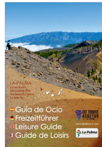
Guía de Ocio