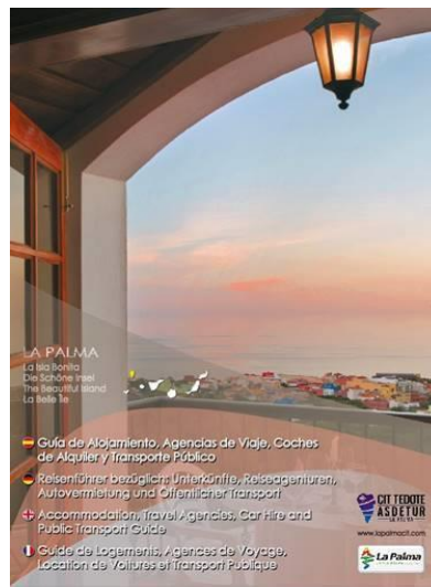
Guía de Alojamientos