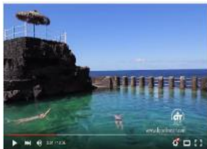
Video promocional de La Palma