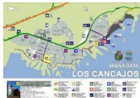
Callejero Los Cancajos