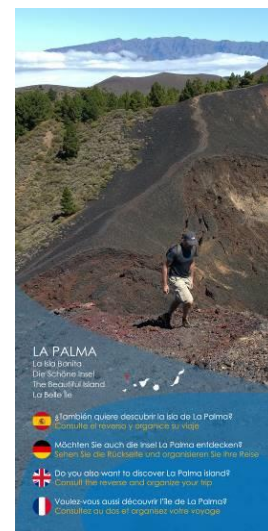
Volandera guías CIT Insular