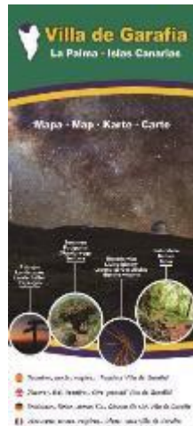
Mapa Villa de Garafía